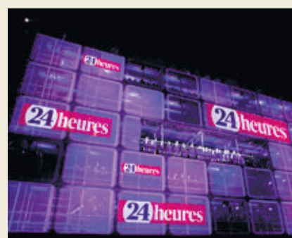
Ce photomontage donne une idée de la taille de la structure.

Il suffit de compléter le questionnaire en ligne figurant sur le site www.24heures.ch/250ans